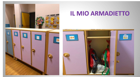
IL MIO ARMADIETTO