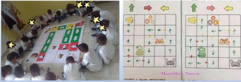
CODING "IMPARARE AD IMPARARE"